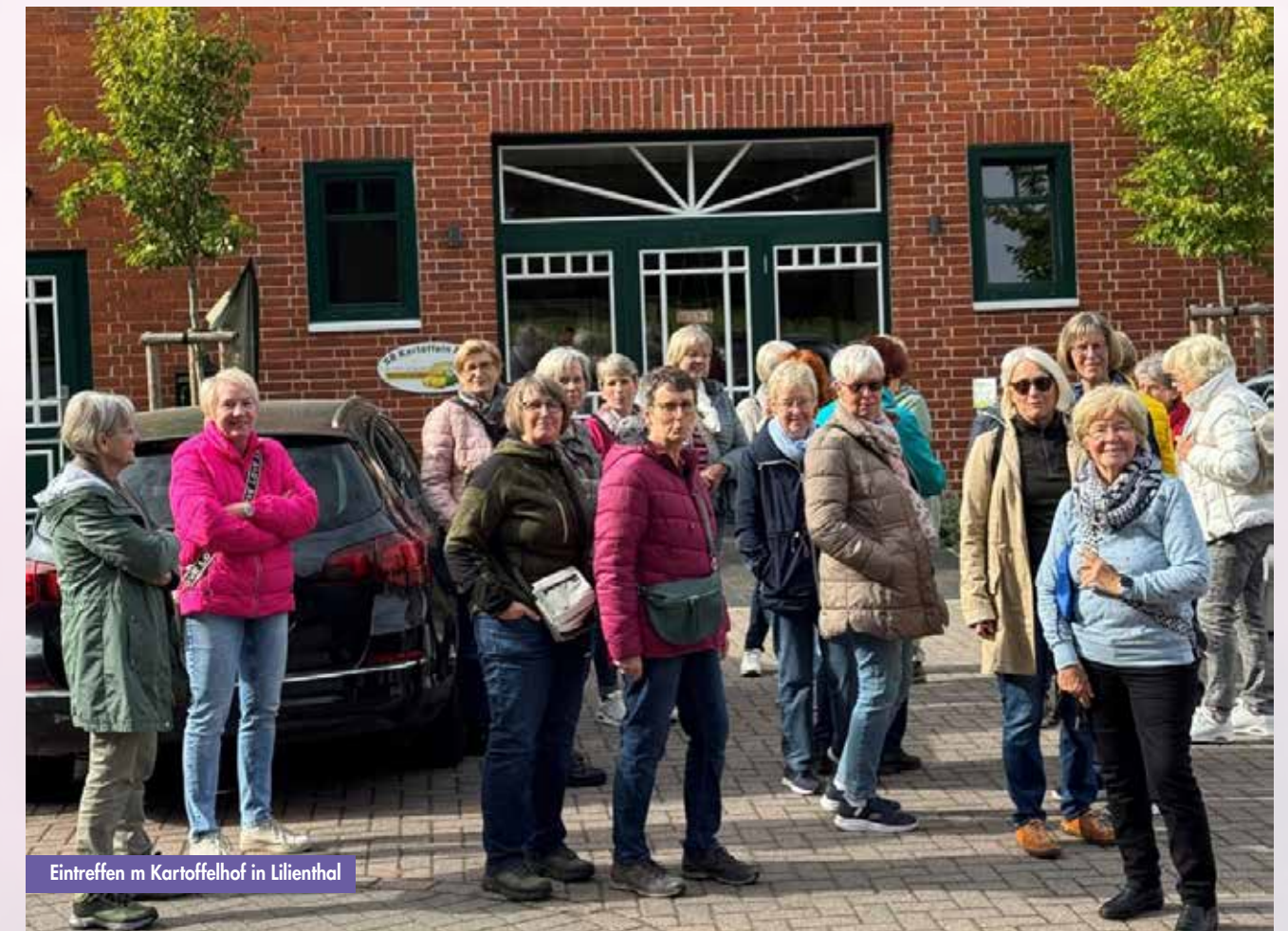
Eintreffen m Kartoffelhof in Lilienthal