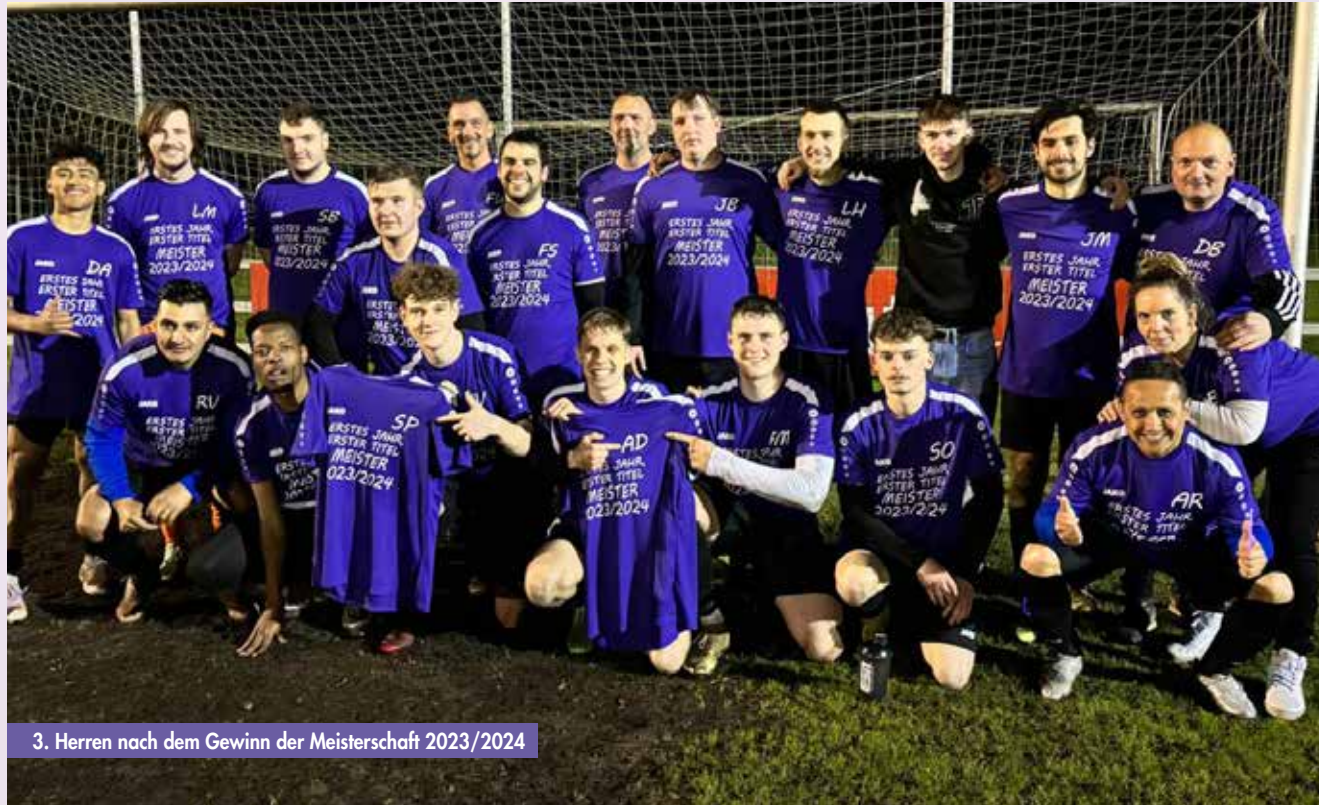
3. Herren nach dem Gewinn der Meisterschaft 2023/2024

Was vielversprechend begann – nämlich der Versuch, eine neue Herrenmannschaft aufzustellen – entwickelte sich zunächst sehr erfolgreich. Nach etwas mehr als zwei Jahren mussten wir unsere 3. Herrenmannschaft jedoch leider vom Spielbetrieb zurückziehen.