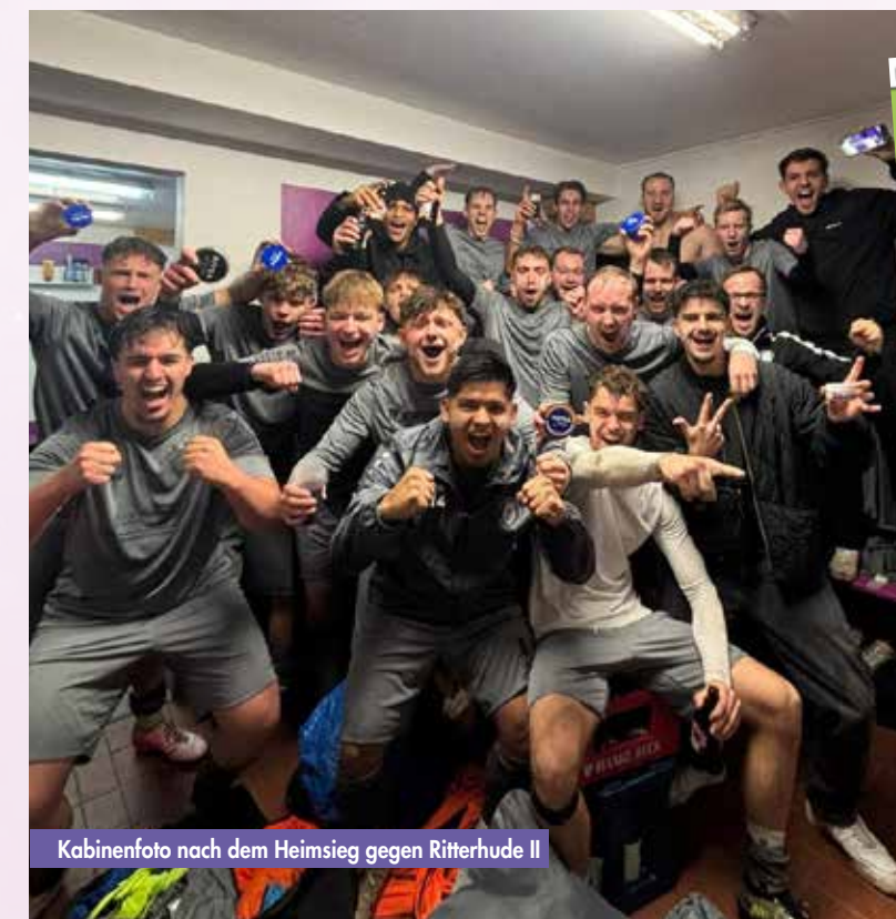
Kabinenfoto nach dem Heimsieg gegen Ritterhude II