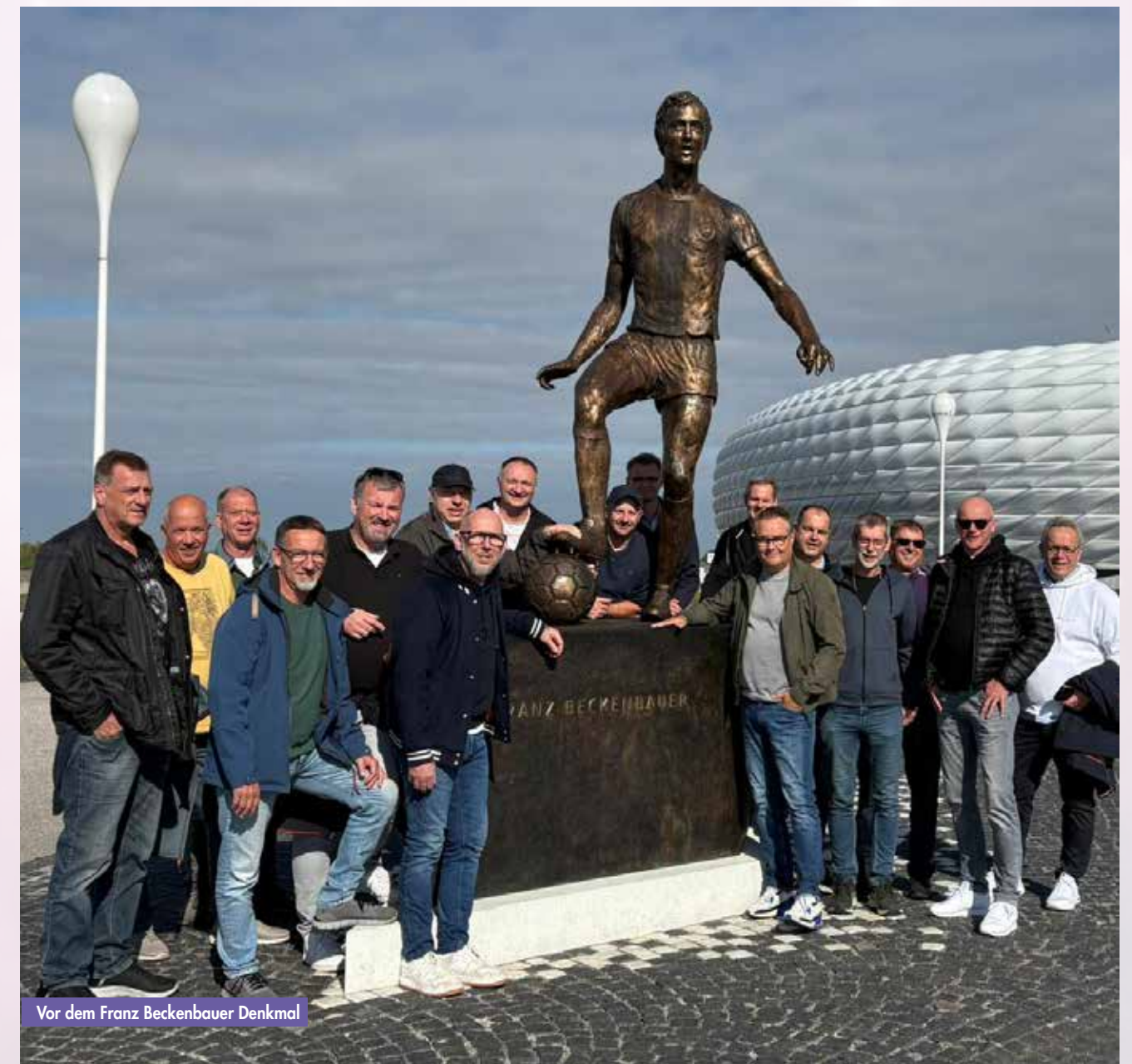
Vor dem Franz Beckenbauer Denkmal